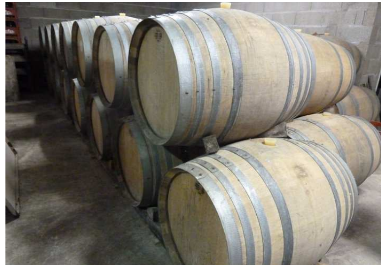
DOMAINE DE VEILLOUX (CHEVERNY). Dans ces fûts, du sauvignon ou du menu-pineau qui serviront à élaborer les blancs du domaine.

Loire, ils finissent bien par s'intéresser aux spécialités locales. A l'orée de la Sologne, vous pourrez ainsi déguster de nombreuses charcuteries et, en saison, des spécialités de gibier. Si les asperges possèdent leur propre confrérie et accompagnent très bien le cheverny, vous ne quitterez pas la région sans déguster un plateau de fromage. En effet, Selles-sur-Cher n'est qu'à quelques encablures, et son chèvre tient souvent compagnie sur les plateaux au Pouligny, à la bûche de Sainte-Maure-de-Touraine, ainsi qu'à l'olivier cendré du Loiret voisin.