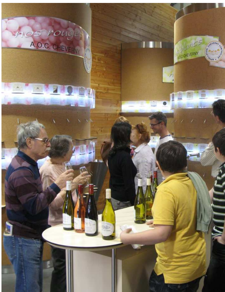
CHEVERNY (LOIR-ET-CHER). Chaque jour, une centaine de cuvées sont présentées à la dégustation à la Maison des vins.