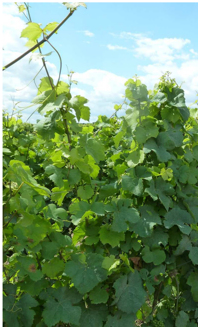
DOMAINE DE VEILLOUX (CHEVERNY). Michel Quenioux cultive ses vignes sans utiliser de produits chimiques depuis une quinzaine d'années.